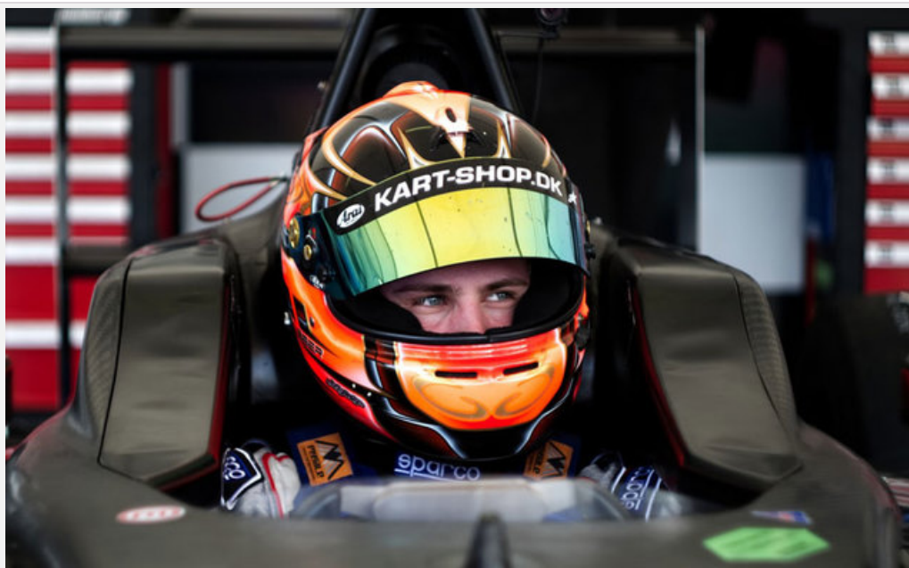
Wyniki SpeedTest.pl we wrześniu. Którego operatora wybrać?

We wrześniu użytkownicy największej polskiej platformy pomiarowej SpeedTest.pl wykonali prawie 2,8 miliona testów. Z czego 2 220 863 pomiarów wykonano za pomocą aplikacji webowej, a 582 826 w aplikacjach mobilnych.