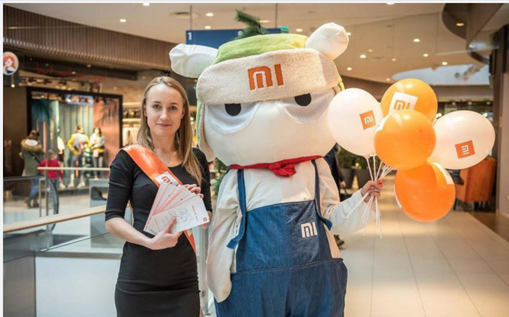
Mi Store w Lublinie

Xiaomi otwiera w Polsce swój 10 sklep Mi Store .