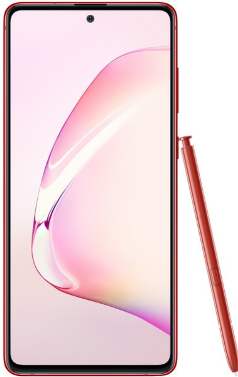
Galaxy S10 Lite