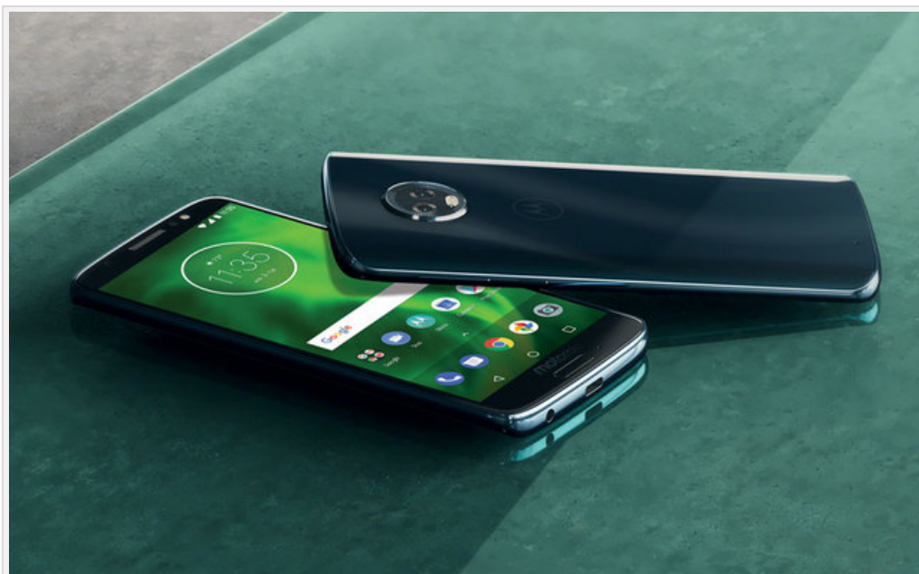
Motorola moto g6

Lenovo poinformowało o wprowadzeniu do oferty nowej rodziny smartfonów Motorola moto g6 .